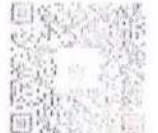
Aponte a câmera do celular e acesse mais notas exclusivas de Carol Kossling.

Para a carne bovina, é adotada uma política de compra livre de desmatamento, que exige que os fornecedores diretos sigam diretrizes rigorosas quanto ao combate ao desmatamento, à proteção de terras indígenas e de unidades de conservação, além do respeito aos direitos humanos. O monitoramento é feito via satélite e, desde 2020, 100% da carne utilizada pela rede é rastreada.